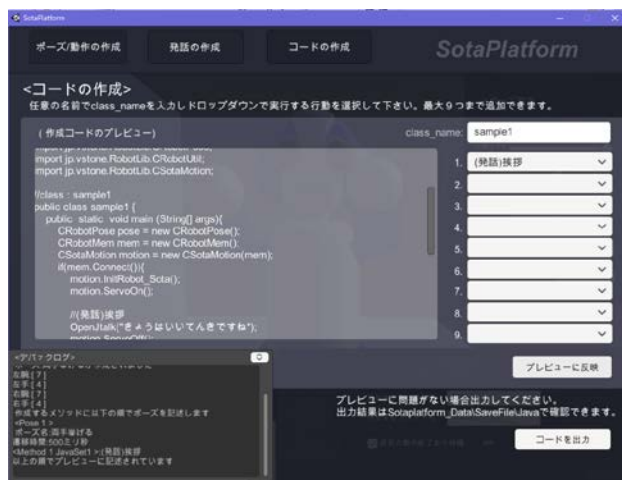
図 1 SotaPlatform コード作成画面

発話機能を実装するにあたり Sota 内に OpenJTalk をインストールした。実行フローは図 4 の通りになっており、発話内容を引数に発話メソッドから OpenJTalk を介して音声合成を行うスクリプトを外部プロセスとして実行することで合成結果を wave ファイルとして出力する。このスクリプトでは音声合成で使用する音声データと辞書など必要なオプションを指定している。また、音声の生成と同時に wave ファイルを再生することで発話を行う。