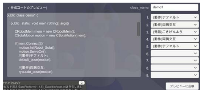
図 7 コードプレビュー画面