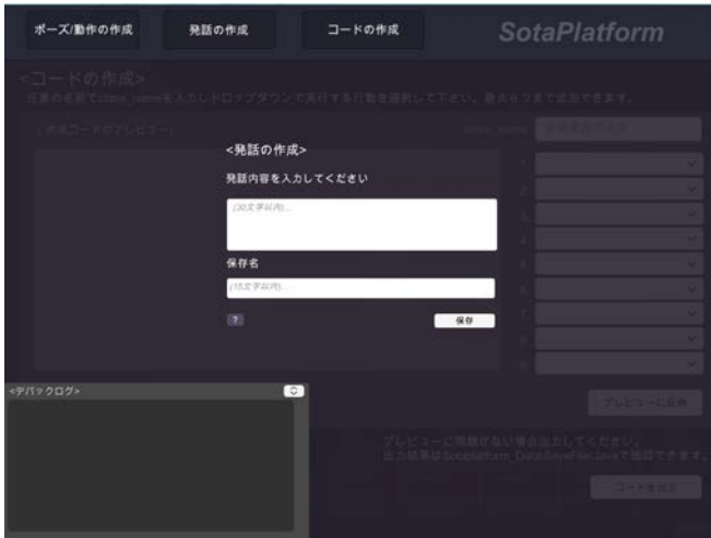
図 3 発話作成画面