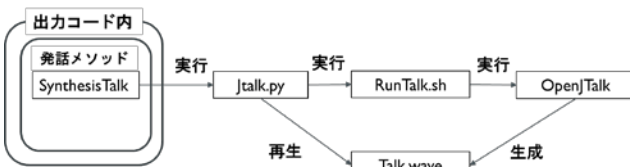
図 4 発話機能実行フロー