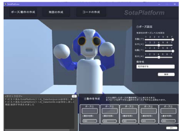
図 5 ポーズ/動作作成画面

Sota に簡単な動作と短い発話を複数回行わせたい場合に本プラットフォームを利用する。また出力後のコードは eclipse など制御用ライブラリのパスが通っている外部 IDE を用いてビルド及び Ant 実行で Sota の実機に転送する。問題がなければ同一ネットワーク内の Sota に SSH 接続を行い、コマンドラインから転送したプログラムを実行する。