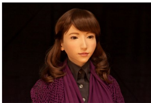
女性アンドロイド (ERICA (エリカ) : 大阪大学石黒研究室)