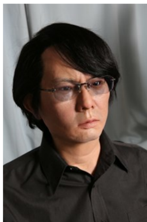
男性アンドロイド (ジェミノイド HI-4 : 大阪大学石黒研究室)