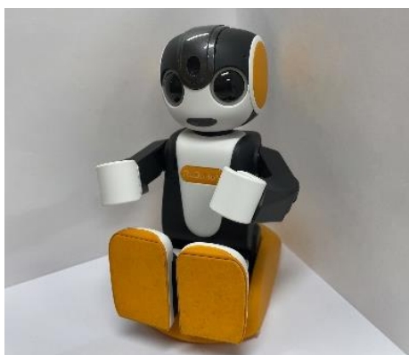
図1 ロボット型の擬人化エージェント (SHARP 製 RoBoHoN)