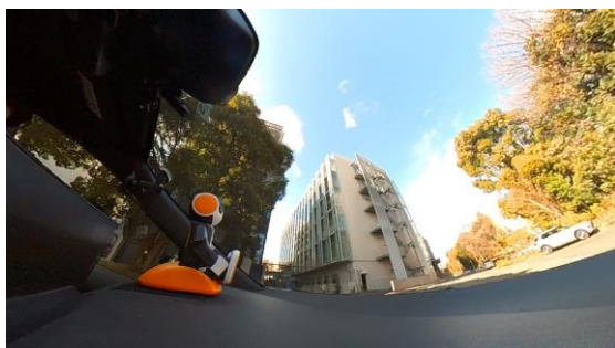
図2(b) ロボホンを設置した様子 (横)