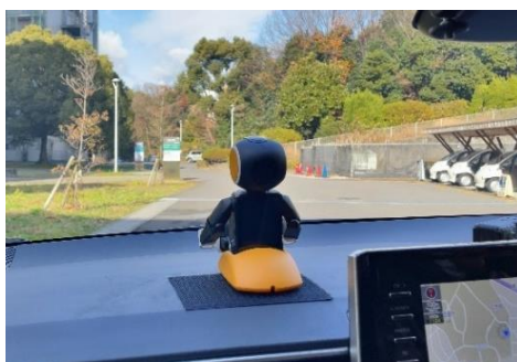
図2(a) ロボホンを設置した様子 (後ろ)