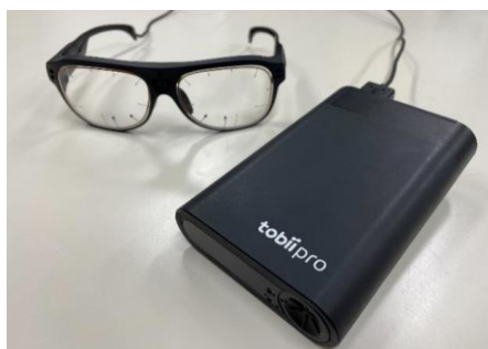
図3 視線測定装置 (トビー製 Tobii Pro グラス 3)

う。視線測定装置の制御ソフトウェア (Tobii Pro グラス 3 コントローラー) を通して、実験参加者の視線情報をリアルタイムで確認し、発話を発生させる。例外がない限り、全ての発話発生地点でほめ発話を発生させるため、1条件での実験をする。エージェントによるほめ (コンプリメント) について調査した研究[7]を参考にし、「明示的で根拠あり」のほめ発話を作成した。発話リストを表1に示す。