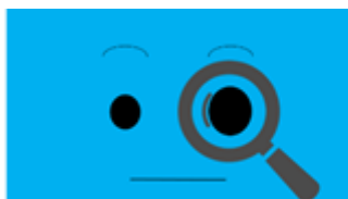
図3 擬人化ゴミ箱にペットボトルを見せた際に表出するイラスト

ユーザにはペットボトルを捨てる際、擬人化ゴミ箱に一本ずつ見せるよう依頼する。これは予備実験で「ペットボトルの状態を見ているとは思わなかった。捨てる時の振動を嫌がっているのかと思った。」という意見が多かったことを参考にしたものである。ペットボトルを見ていることがよりユーザに伝わるよう、図3のように見ているときの顔を表出する。