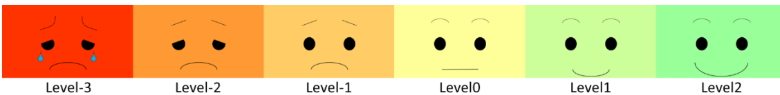
図2 擬人化ゴミ箱の表情の一例

図2に本研究で提示する表情の一例を示す。各表情は便宜上 Level という値をつけて分類する。表情はフェイスケールを参考に涙を流すといった悲しみを表現するように著者がデザインした[12]。フェイスケールとは痛みの程度を表情で表現するもので医療の現場で用いられるもので6~20段階のもの