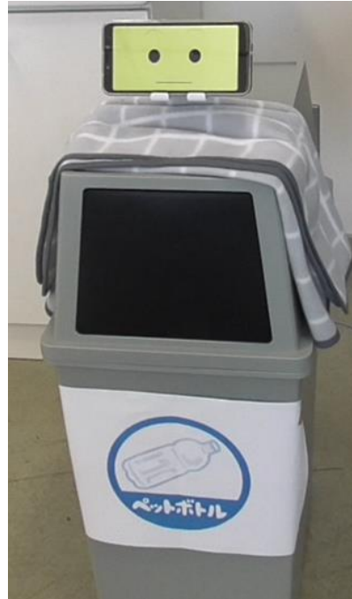
図1 擬人化ゴミ箱の外観

この擬人化ゴミ箱は分別されたペットボトルを捨てると笑顔を表出し、そうでないペットボトルを捨てると悲しむようなネガティブな表情を表出するように設計する。その結果、人は擬人化ゴミ箱に感情移入し、分別をした方がよいという自身の知識から擬人化ゴミ箱の意図を推測し、それに沿って分別するようになるのではないかと考えられる。この考えが妥当であるか、人と擬人化ゴミ箱のインタラクション実験を通して調べる。